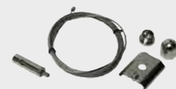
- Kit de suspensión